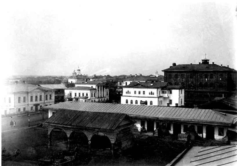
Лавки гостинного двора в Енисейске