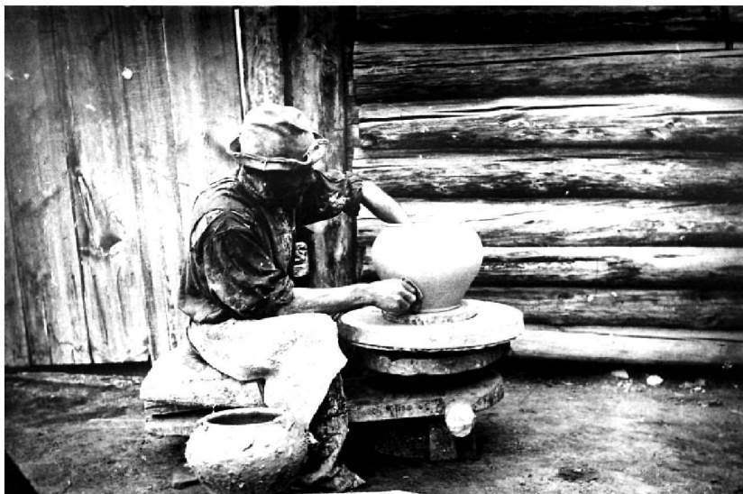
Кустарь-горшечник. с. Атаманово. Начало XX в.