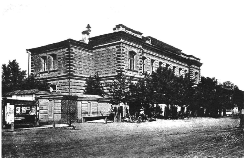
Здание Красноярского отделения Госбанка