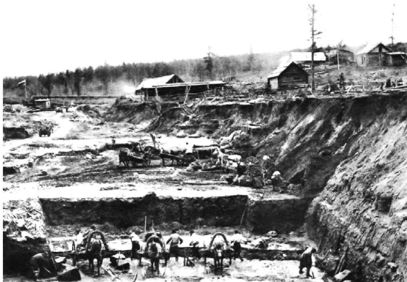
Добыча золота открытым способом. Рождественский прииск