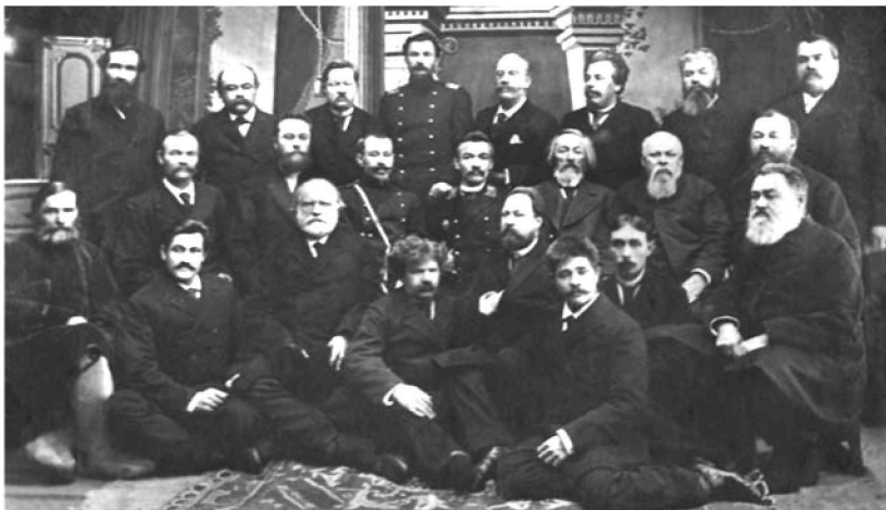
Участники 1-го съезда золотопромышленников Енисейской губернии. 1898 г.