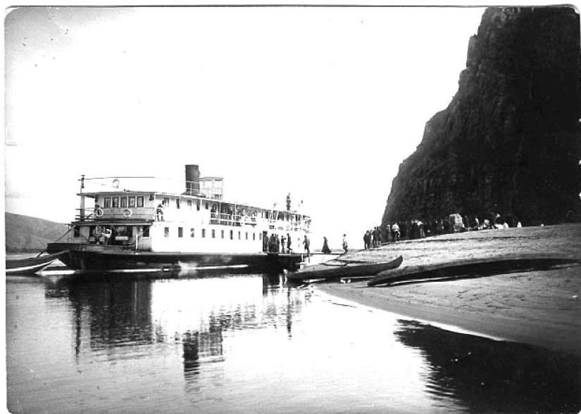
Батеневская пристань. Минусинск