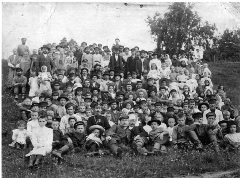
Рабочие и жители Знаменского стекольного завода. Начало XX в.