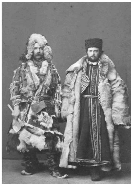
Енисейские купцы на Нижегородской ярмарке