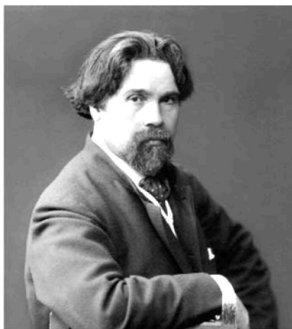
Выдающийся русский художник В.И. Суриков