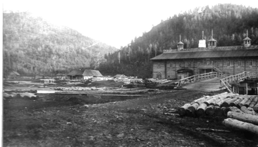
Винокуренный завод Яриловых. Минусинский округ