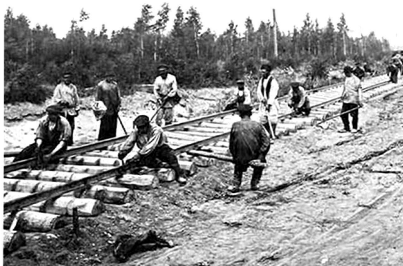
Строительство Транссиба на Среднесибирском участке