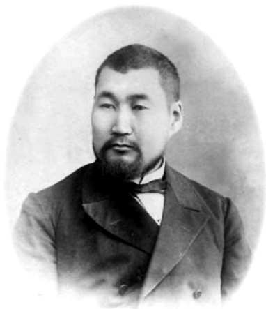
Н.Ф. Катанов, ученый-тюрколог