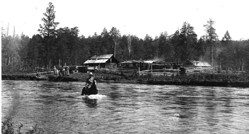
Крестьянская заимка. Приангарье. Начало XX в.