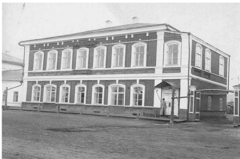
Здание учительской семинарии в Красноярске