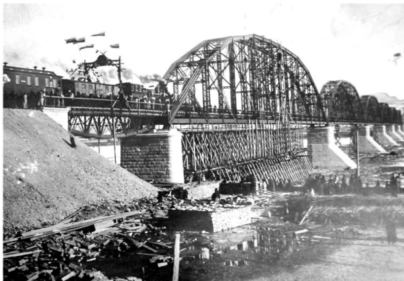
Строительство железнодорожного моста через Енисей в Красноярске