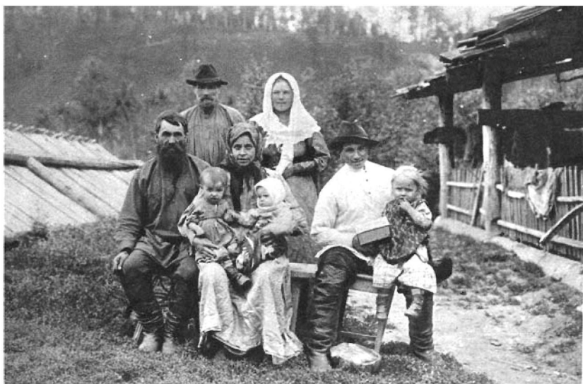
Семья крестьян-старожилов. Красноярский уезд. Начало XX в.