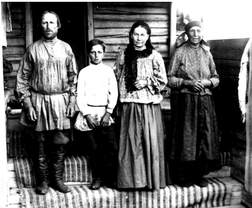
Крестьянская семья из д. Ловать Канского уезда