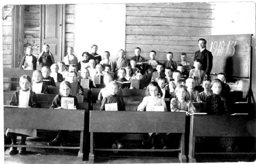
На уроке в школе на Знаменском стекольном заводе