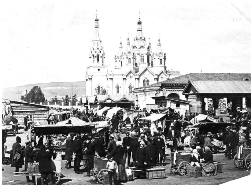
Базар в Красноярске. Новобазарная площадь