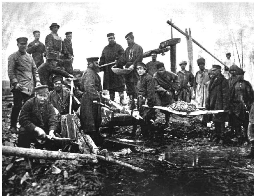
Промывка золотоносной породы на Кызаском прииске Ачинского уезда