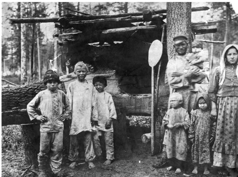
Крестьяне-переселенцы у временного жилья. Минусинский уезд. Конец XIX в.