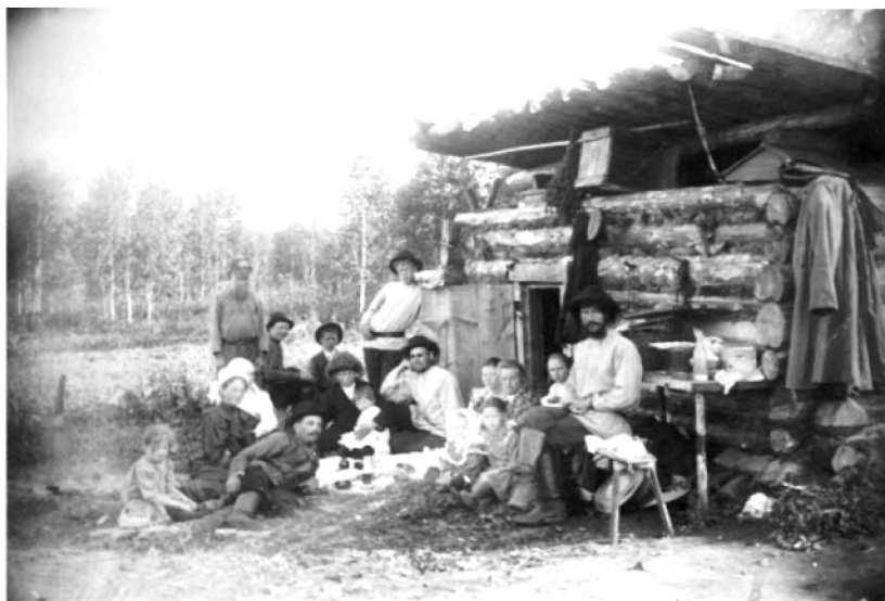
Рабочие Леонидовского винокуренного завода. Конец XIX в.