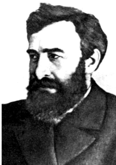
Н.М. Мартьянов, основатель Минусинского музея