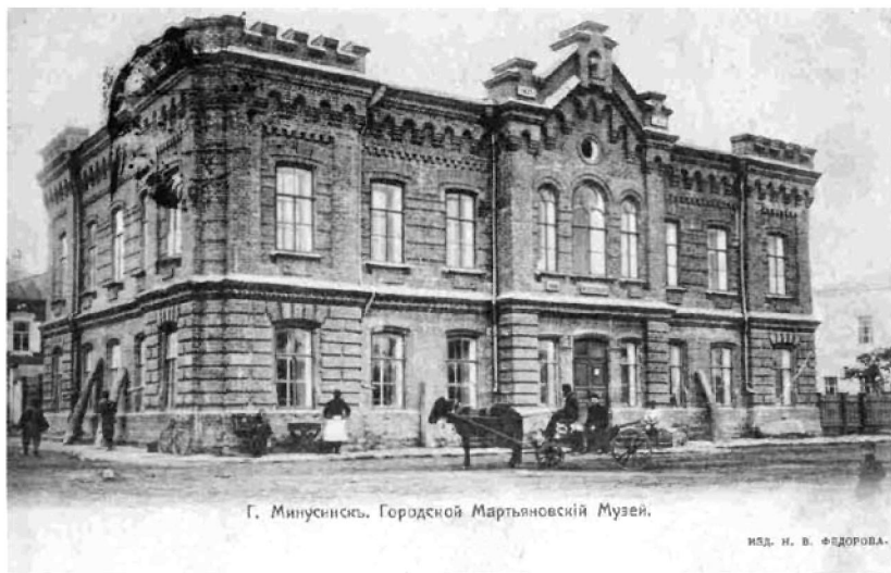
Г. Минусинск. Городской Мартьяновский Музей.