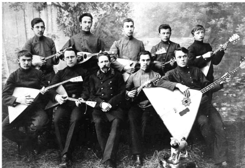
Струнный оркестр Енисейской гимназии