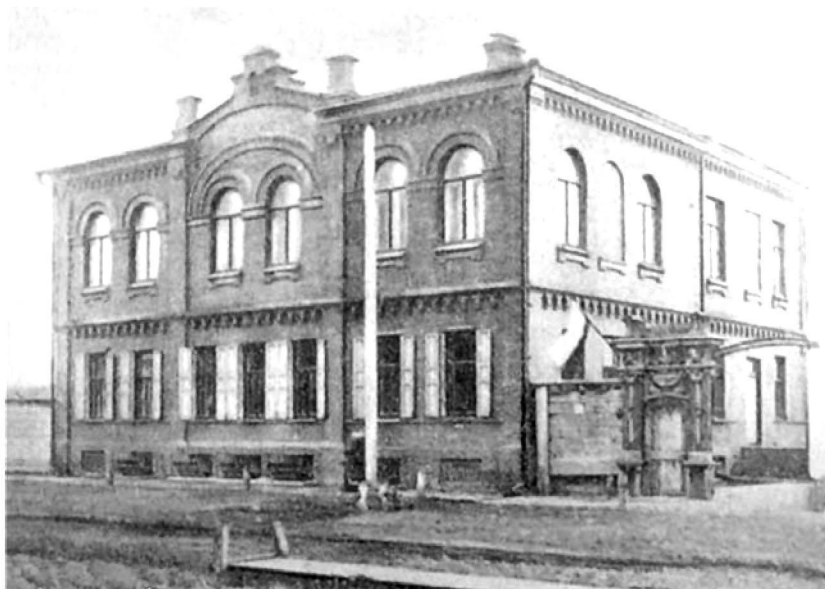
Фельдшерская школа. Красноярск, 1903